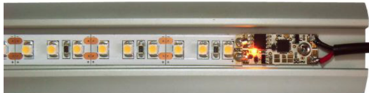
Obr.1 - Ukázka instalace do profilu

*) Napájecí napětí nesmí být vyšší, než maximální napětí použitého LED pásku! **) V režimech 3 a 4 bez stmívání je maximální proud 10A.